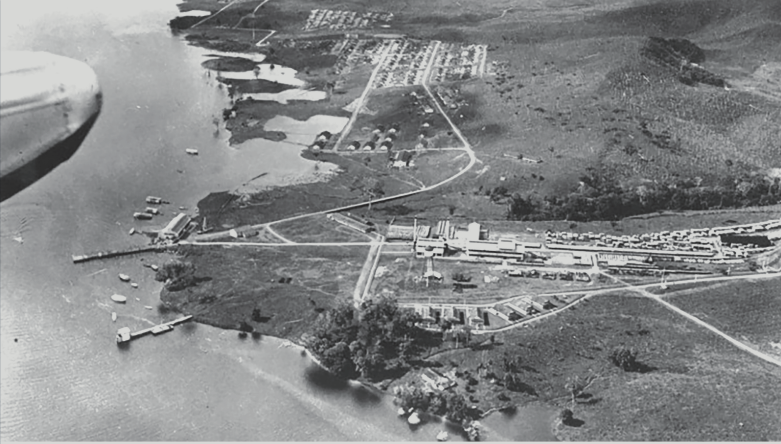
Fordlandiya'dan bir görünüm (üstte) ve Fordlandiya'da kauçuk fidanları (alt solda)